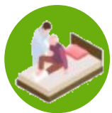
Professionnels de santé

Le DAC 61 informe, oriente, accompagne vers un parcours de santé et de vie coordonné* entre différents professionnels